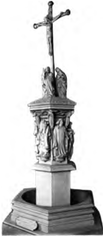
Restitution du Puits des Prophètes (Musée de Dijon).

plus étonnante du groupe. Ce n'est pas le jeune prophète de race royale, que concevront Michel-Ange et Raphaël. Le crâne chauve, le front ridé, il laisse tomber sur sa poitrine sa longue barbe et sa moustache fourchue. Il possède un livre où l'avenir est écrit ; il a un encrier et une plume pour compléter ce livre ; mais il ne lit plus, il n'écrit plus : soixante-quatre ans de prophéties mal écoutées lui ont enlevé ses illusions.